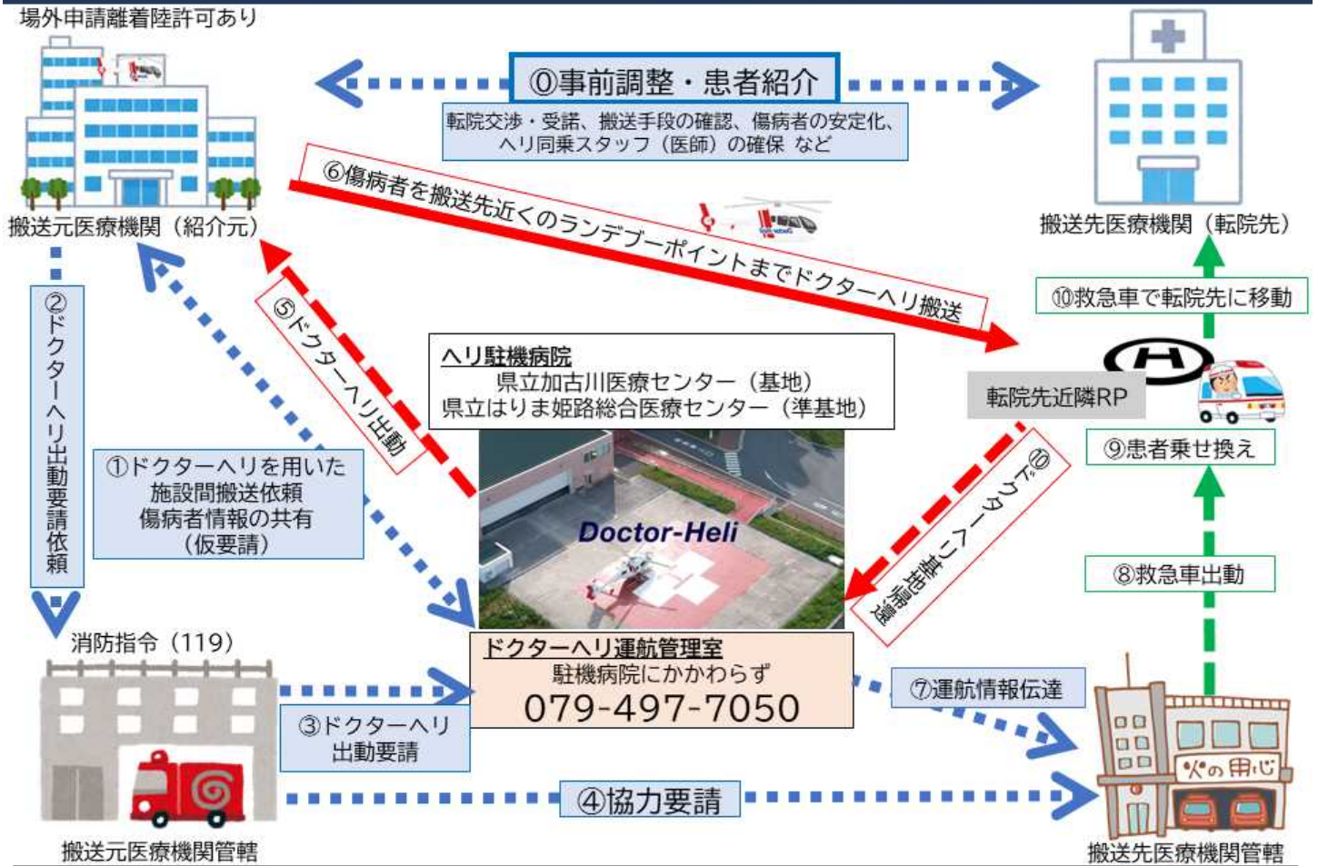
図3 施設間搬送：ヘリポートのある病院⇒ヘリポートのない病院 (搬送先近くのランデブーポイントの設定とそこからの救急車移動が必要)