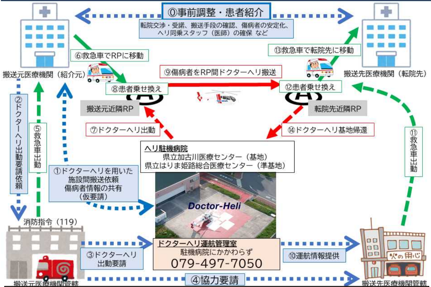
図4 施設間搬送：ヘリポートのない病院⇒ヘリポートのない病院 (搬送元・搬送先ともに近くのランデブーポイントの設定とRPと病院間の救急車移動が必要)